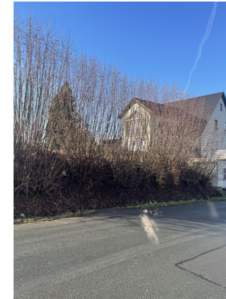
nördliche Haselhecke, Blickrichtung Westen