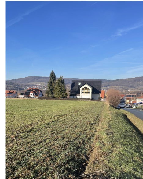
vorhandener Acker mit angrenzendem Graben, Blickrichtung Norden